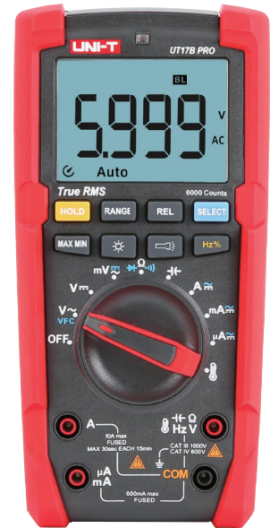
● UT17B PRO